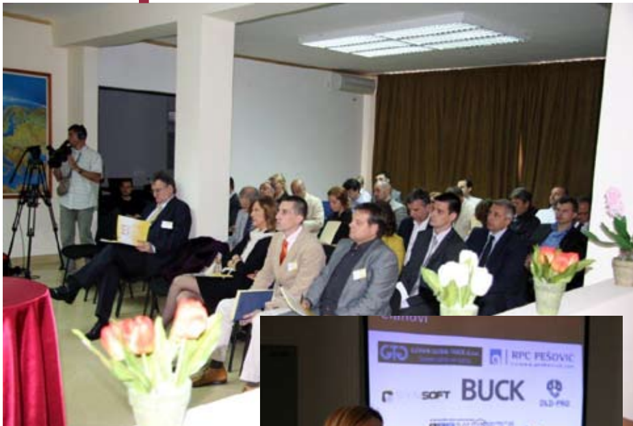
Nastavak sa strane I

Članice iz Srbije bave se najviše prehrambenim delatnostima, ali i inženjeringom i IT sektorom.