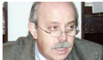
Milan PROSTRAN: Hrana za naftu

područja. Kao jedan od konkretnih oblika saradnje pomenut je organizovan nastup srpske privrede na prestižnom sajmu prehrane Gulfood 2014. koji se održava u Dubaiju uz svesrdnu logističku podršku MEBAS-a. Nastup na sajmovima tog ranga otvara perspektivu za plasman domaće robe i na tržištima Srednjeg i Dalekog istoka.